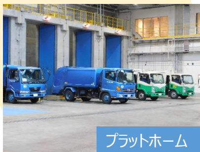
プラットフォーム

ごみ収集車は、プラットフォームに入り ごみを投入する扉からごみピットにご みを投入します。