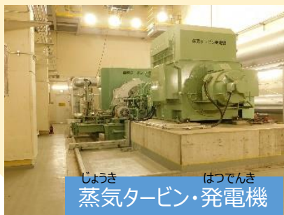
蒸気タービン・発電機